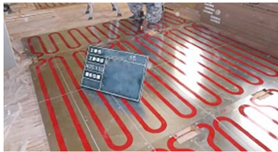
電気式床暖房の施工。床面温度は26℃が設計の目安になる

その内容を紹介すると、まず床面温度は国際標準化機構（ISO）に規格（ISO7730）があり、床表面温度は19～26℃の間であること、床暖房は29℃として設計して良いことなどを定めています。ISOでは暖房方式にかかわらず、床面の