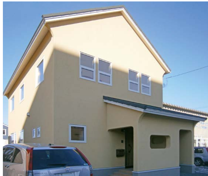
今年1月に完成した釧路市内初の認定低炭素住宅

築を検討。固定資産税の減免期間は長期優良住宅のほうが2年間長いものの、住宅ローン減税の最大控除額拡充や、当初10年間の金利が優遇されるフラット35Sの適用といったメリットは変わらず、低炭素住宅の認定基準も標準仕様でクリアできます。そのためコストアップは、外皮平均熱貫流率(U A 値)と一次エネルギー消費量の計算の外注費用など15万円ほどで済むことから、低炭素住宅で建設することが決まりました。