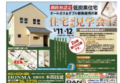
完成見学会のチラシ。ダブル断熱やオールガスも関心と呼んだ