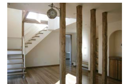
室内はエイジング風に塗装した柱や造作収納がアンティークな雰囲気を感じさせる