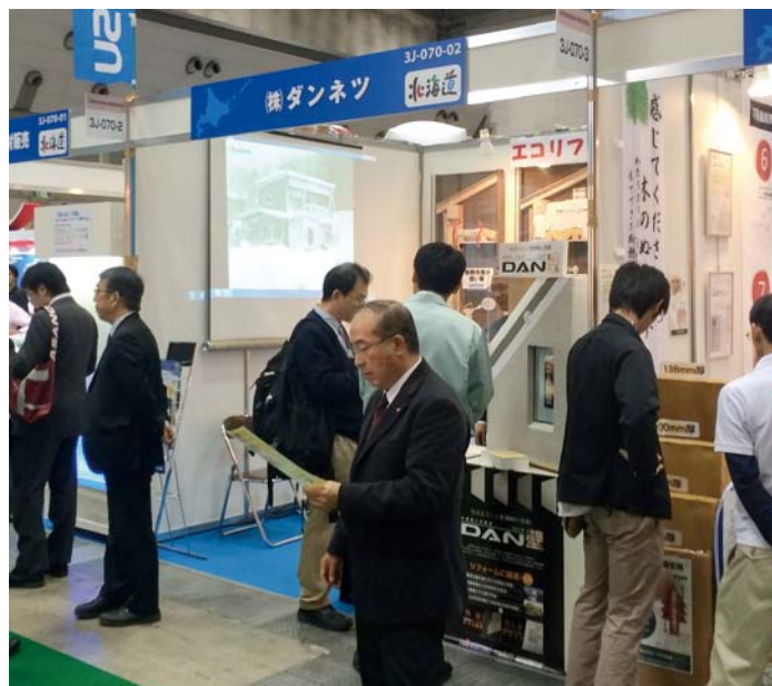
「断熱リフォーム」をテーマに製品展示等を行ったダンネツのブース

期間中の来場者数は約32,000名で、昨年より5,000名近く増加。ダンネツの展示ブースにも多くの来場者がいらっしゃいましたが、特に住宅の設計に関わる方が目立ち、ブローイング工法やウレタン吹付工法については温暖地でまだ普及途上ということもあってか、リフォームだけにとどま