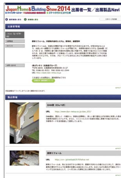
ジャパンホームショーのホームページに掲載された出展社情報